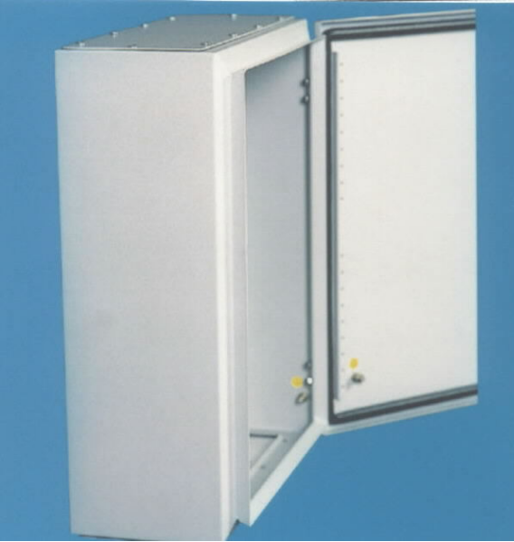
2.2 Elektrik Pano Dolabı