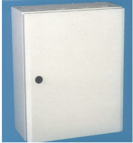
2.1 Elektrik Pano Dolabı