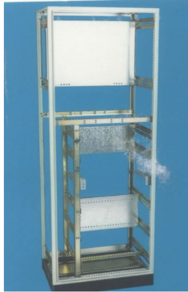
3.1 Elektrik Pano Dolabı skeleti