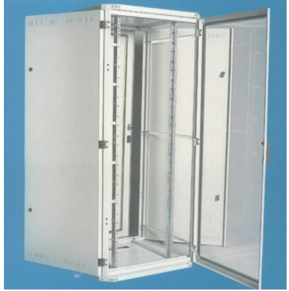
4.2 Elektrik Pano Dolabı