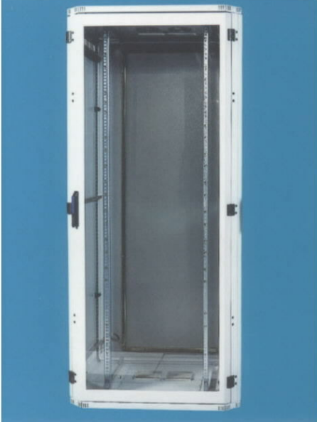
4.1 Elektrik Pano Dolabı