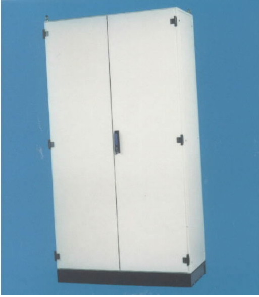
1.1 Elektrik Pano Dolabı